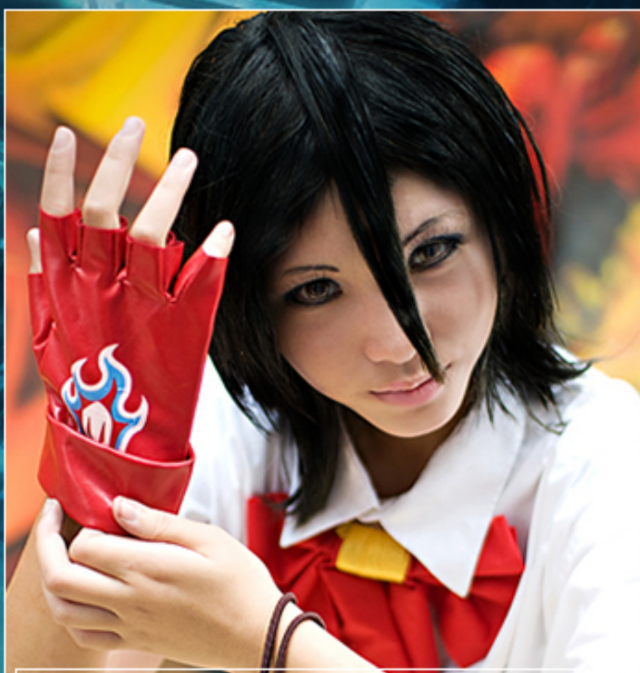
"Rukia Kuchiki" (Bleach)