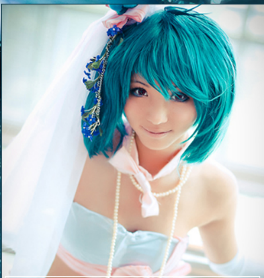
"Ranka Lee" (Macross Frontier)