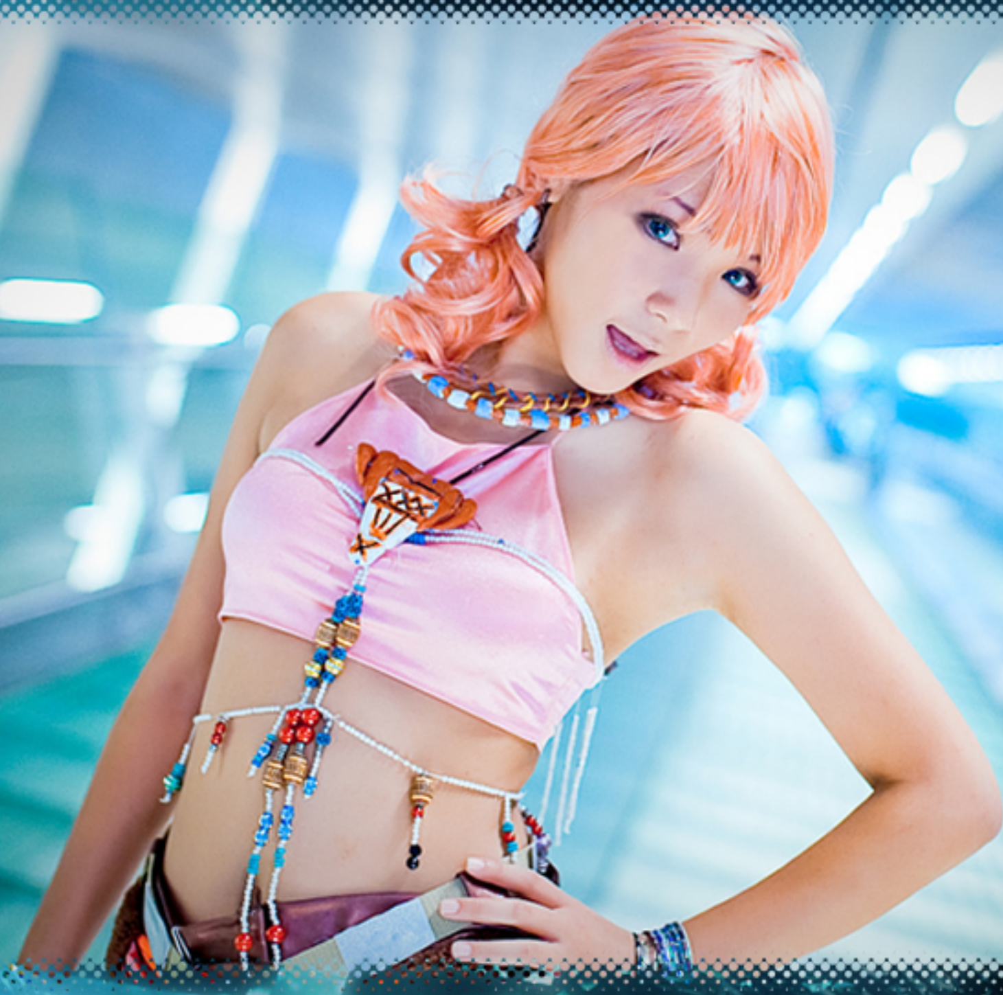
"Oerba Dia Vanille" (Final Fantasy XIII)