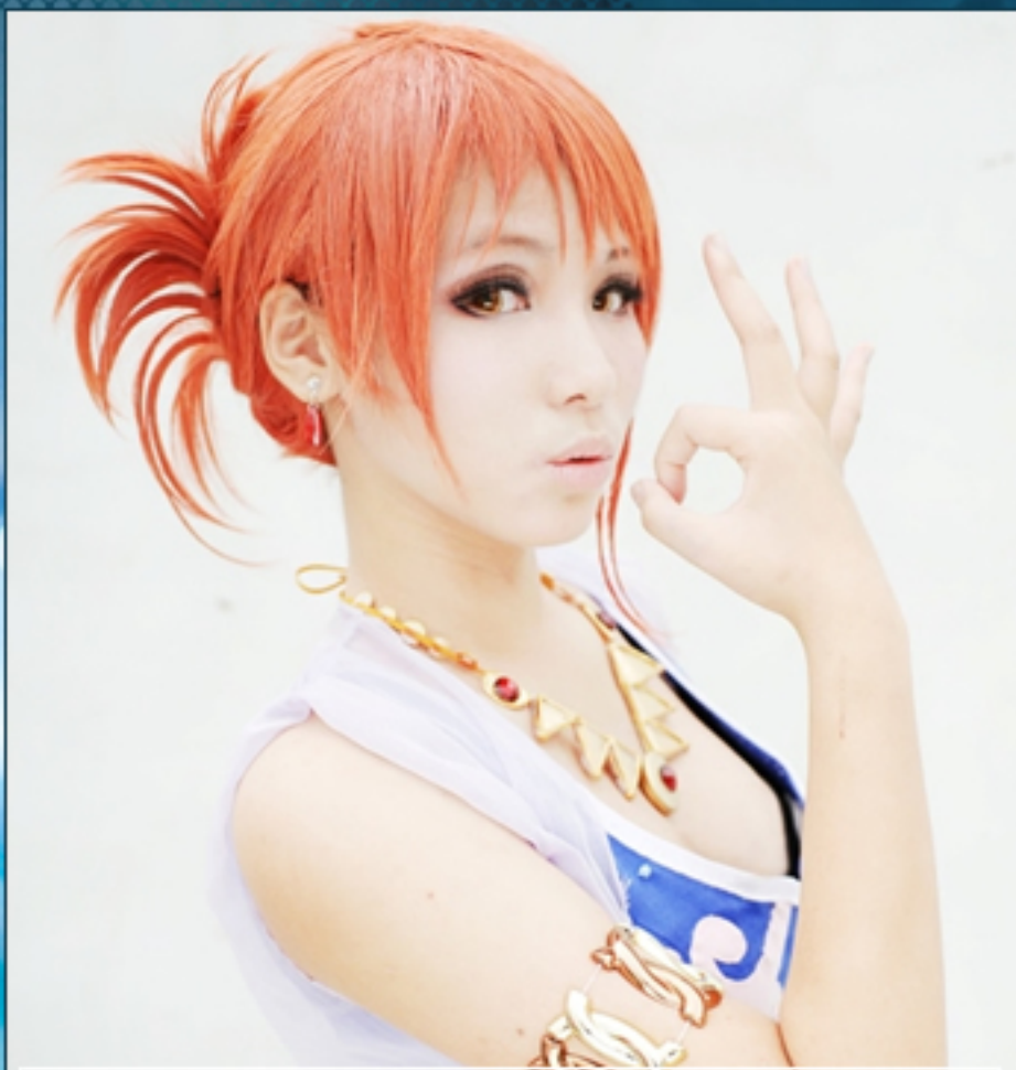
"Nami" (One Piece)