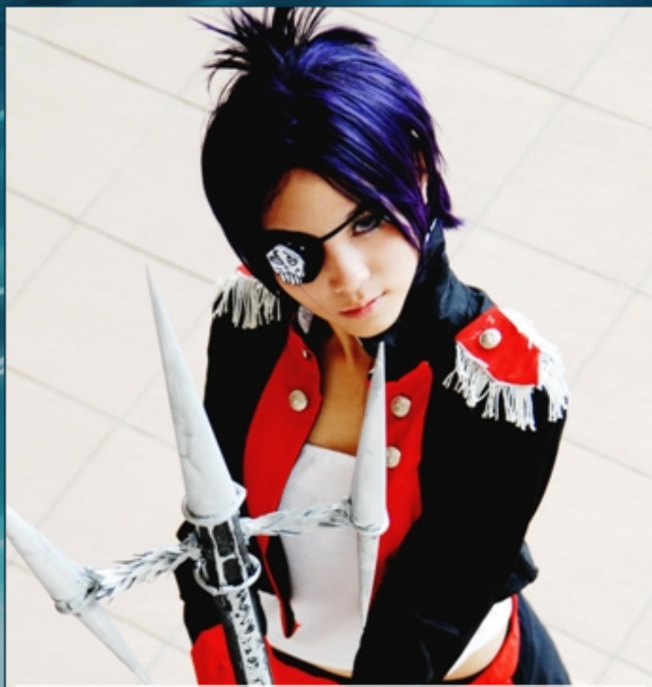
"Chrome Dokuro" (Katekyo Hitman Reborn!)